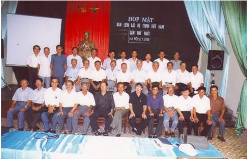
Hội nghị thành lập Ban Liên lạc họ Trịnh Việt Nam(16/ 7 2006)

Từ giữa năm 2006 đến cuối năm 2007, Ban Liên lạc họ Trịnh Việt Nam triển khai một số hoạt động trong bối cảnh mới. Những yêu cầu của giai đoạn mới đòi hỏi phải tổng kết rút kinh nghiệm giai đoạn hoạt động hơn chục năm qua, và đề xuất phương thức hoạt động mới cho phù hợp hơn.